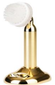
► BeauHwa with the pore brush