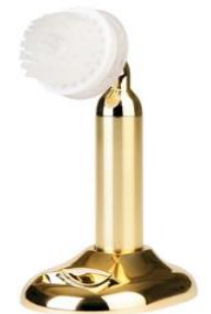
► BeauHwa with the pore brush